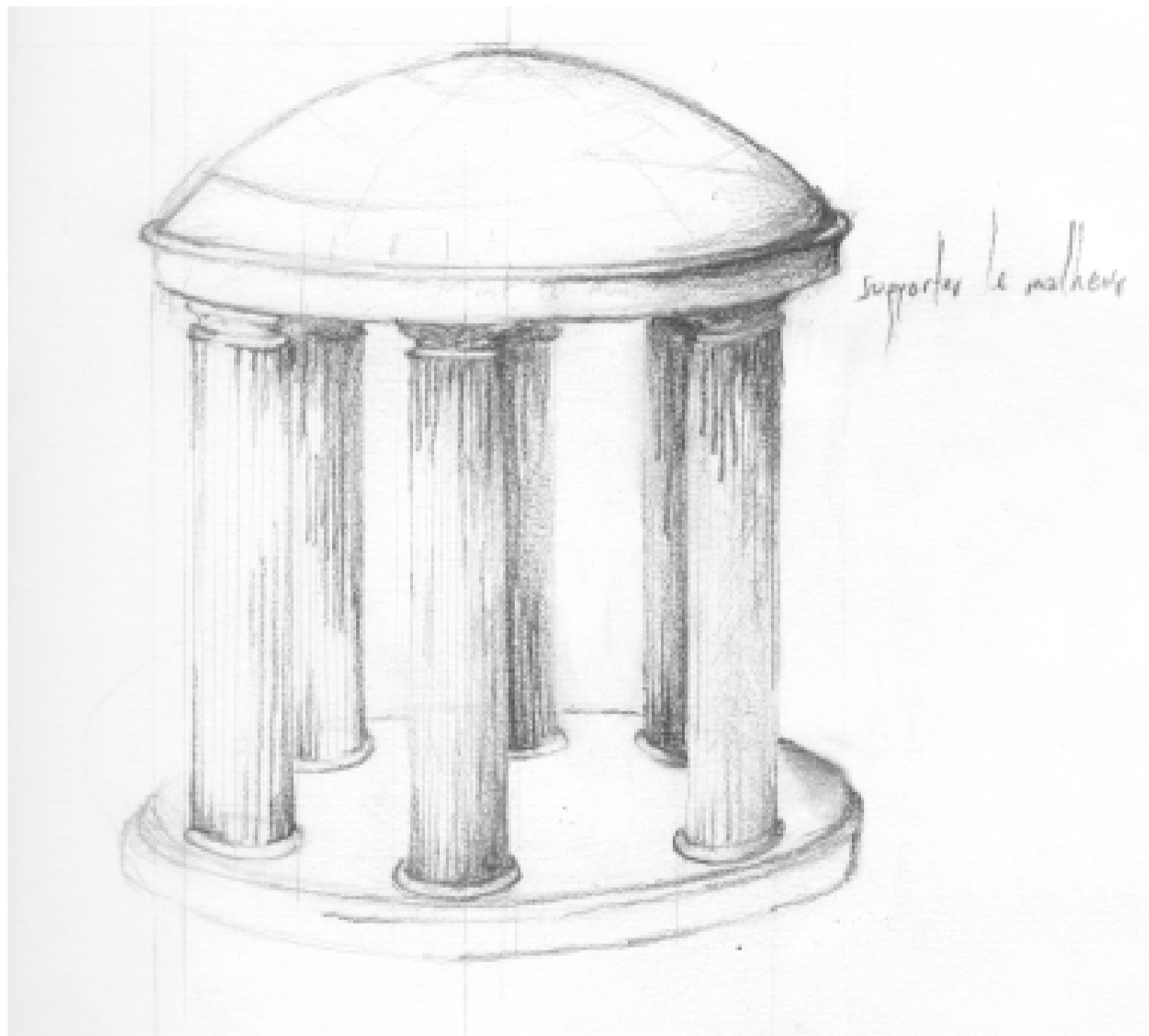
LE TEMPLE DE L'AMITIÉ ET DE LA PAIX VU PAR © MARIA ADELAIDA SAMPER / MARS 2013

Les vestiges du monument symbolisant l'amitié entre les peuples dorment depuis plus de soixante ans dans un dépôt municipal. La disparition de la forme signifie-t-elle la disparition de la mémoire? PAR MARIA ADELAIDA SAMPER ET KATE MCHUGH STEVENSON