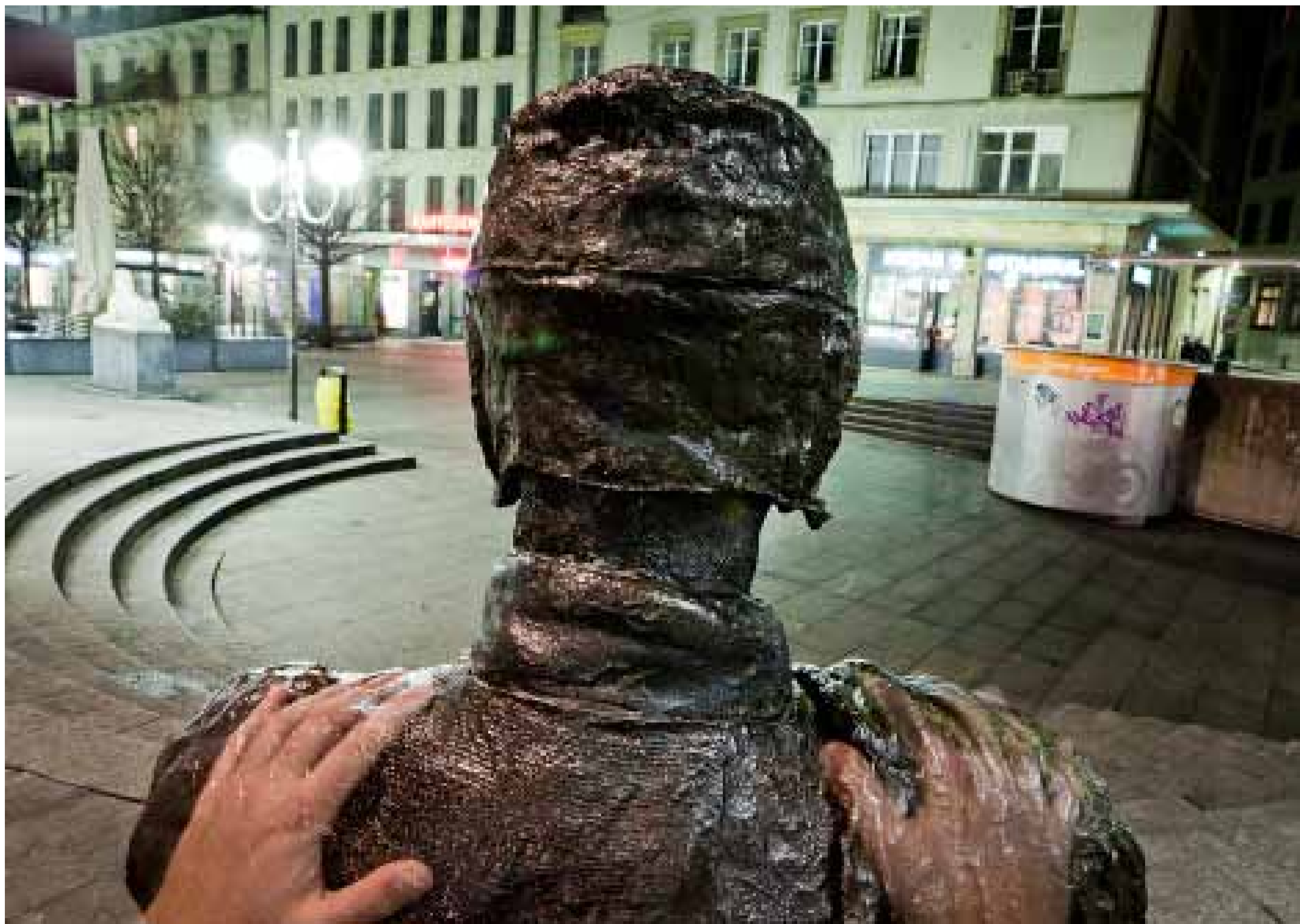
SCULPTURE DE BRONZE REPRÉSENTANT UN HOMME ASSIS AVEC, SUR SES GENOUX, UN JOURNAL, L'IMMIGRÉ REND HOMMAGE À CELLES ET CEUX QUI ONT QUITTÉ LEUR PAYS ET SE SONT, POUR DES MOTIFS DIVERS, INSTALLÉS À GÈNÈVE.