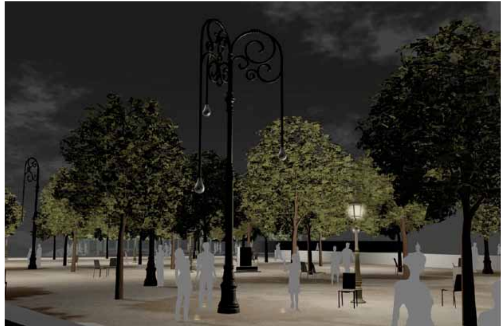
L'ŒUVRE DES RÉVERBÈRES DE LA MÉMOIRE, COMPOSÉE DE NEUF RÉVERBÈRES DE HUIT MÈTRES DE HAUT, EST INSPIRÉE DES LAMPADAIRES DE NEW YORK

La découverte des vestiges de l'église Saint-Laurent a clos le débat et scellé l'abandon du projet d'implantation du monument. Alors, qu'est-ce qui fait l'Histoire? Des fouilles qui mettent au jour un passé vieux de plus de 400 ans, un monument commémorant un événement du siècle dernier, ou les deux? Initialement prévue en avril 2012, la réalisation de