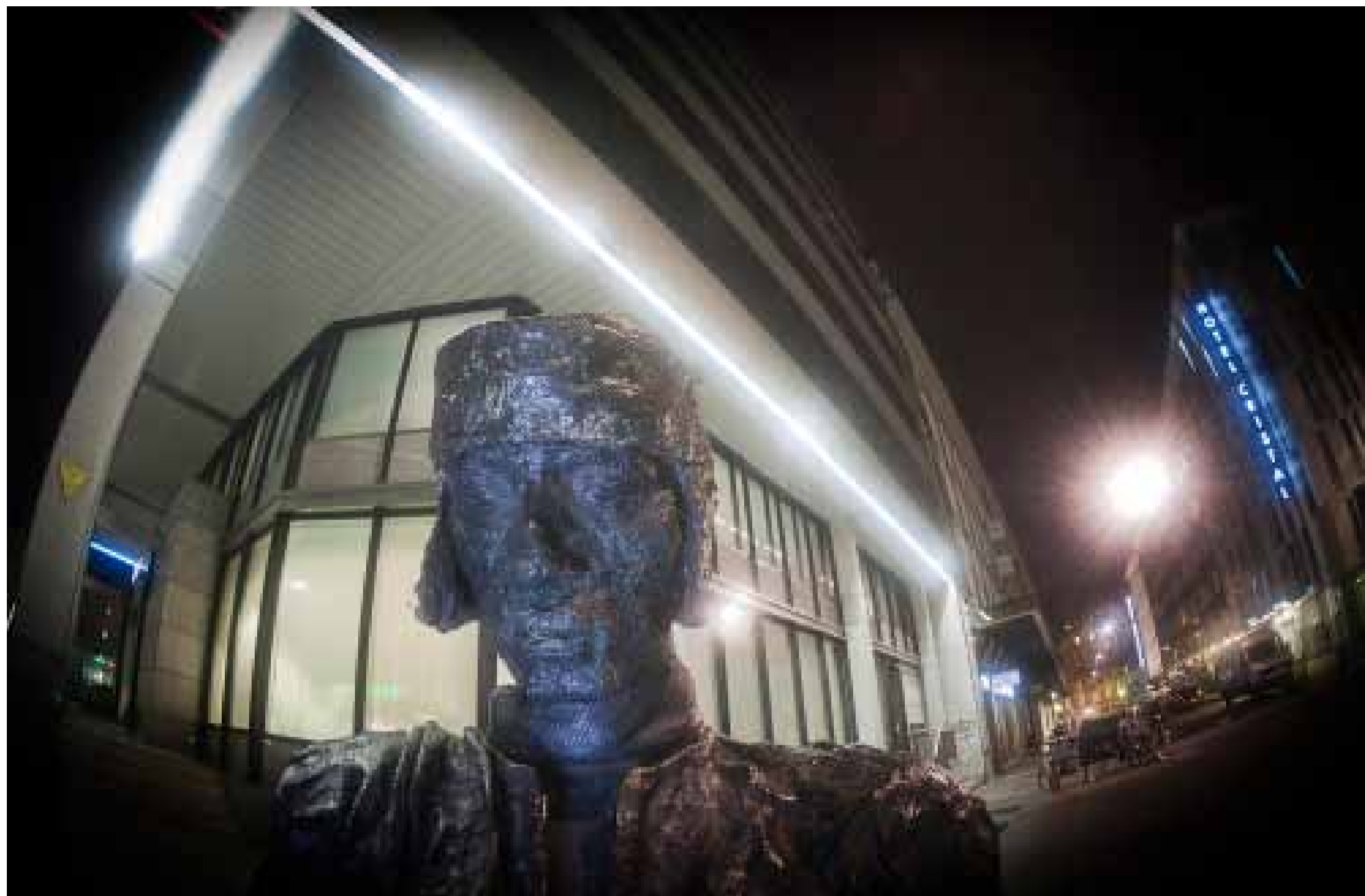
L'IMMIGRÉ. SUR LA SCULPTURE ELLE-MÊME AUCUNE INDICATION N'EST DONNÉE. IL FAUT DESCENDRE LES MARCHES QUI MÈNENT À LA RUE PIETONNE, PLACE DU MONT-BLANC, POUR DÉCOUVRIR PAR TERRE UNE PLAQUE AVEC DES INFORMATIONS.