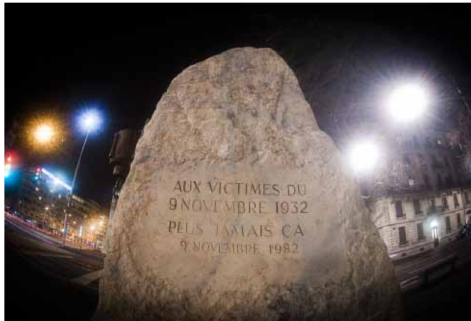
LA FUSILLADE DU 9 NOVEMBRE 1932 FAIT AUJOURD'HUI PARTIE DE L'HISTOIRE GÉNEVOISE.

À l'initiative de l'Union des syndicats genevois et du Comité d'organisation du 1 er mai, c'est en 1992 qu'une nouvelle plaque est apposée en plus de la première. Celle-ci ne nécessite pas de demande d'autorisation, la pierre étant alors un emblème acquis pour la gauche et les institutions genevoises. L'intention était de mieux retranscrire les faits historiques par un texte indicatif plus long que les passants peuvent aujourd'hui toujours lire cette plaque